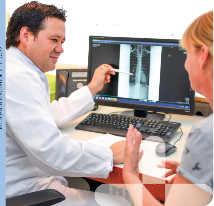
KHTBB-KONS.ORTH-DOK V1.6 07/22